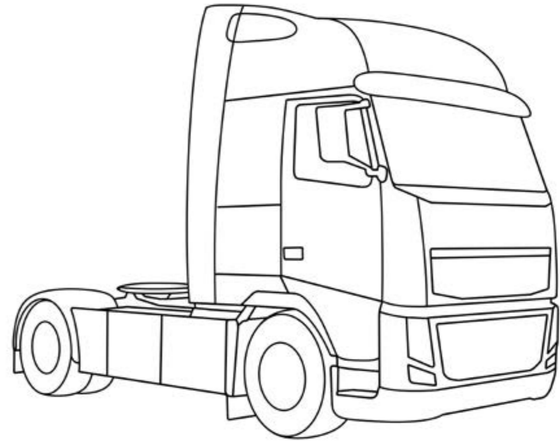
Ciągnik siodłowy to pojazd przeznaczony do ciągnięcia naczep.