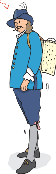
Polski marynarz z okresu wojny polsko-szwedzkiej