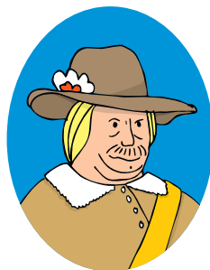
Arend Dickmann (1572-1627) był admirałem polskiej floty. Polacy wygrali bitwę, ale on zginął trafiony przypadkową kulą

W 1627 roku w czasie wojny polsko-szwedzkiej na wodach Zatoki Gdańskiej rozegrała się bitwa pod Oliwą .