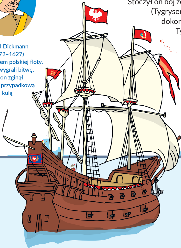
Proporzec bojowy polskich okrętów wojennych w XVII wieku

Najważniejszym statkiem polskiej floty był Święty Jerzy . Stoczył on bój ze szwedzkim okrętem Tigern (Tygrysem). Polscy marynarze dokonali abordażu** i zdobyli Tygrysa.