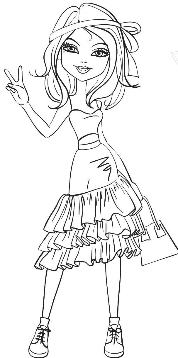
piękne siostry bliźniaczki