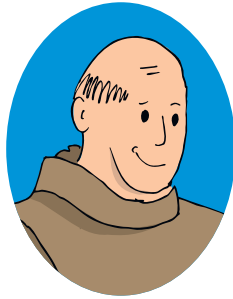
Benedykt Polak (około 1200-1280)

Benedykt Polak nazywany jest pierwszym polskim podróżnikiem . Wraz z wystannikiem papieskim Janem di Piano Carpini przebył drogę z francuskiego Lyonu do Karakorum – stolicy Imperium Mongolskiego. Wieźli oni listy od papieża Innocentego IV do chana mongolskiego.