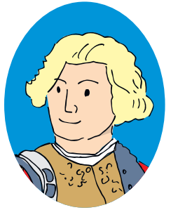
Maurycy Beniowski (1746-1786)

Maurycy Beniowski urodził się na Węgrzech, jednak wielokrotnie w swoich pamiętnikach zapewniał, że jest Polakiem. W 1769 roku w czasie wojny polsko-rosyjskiej dostał się do niewoli, później zesłano go aż na Kamczatkę . 8 lat planował ucieczkę. Gdy nastąpił odpowiedni moment, więźniowie opanowali port i statek Święty Piotr i Paweł.