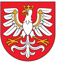
herb województwa małopolskiego