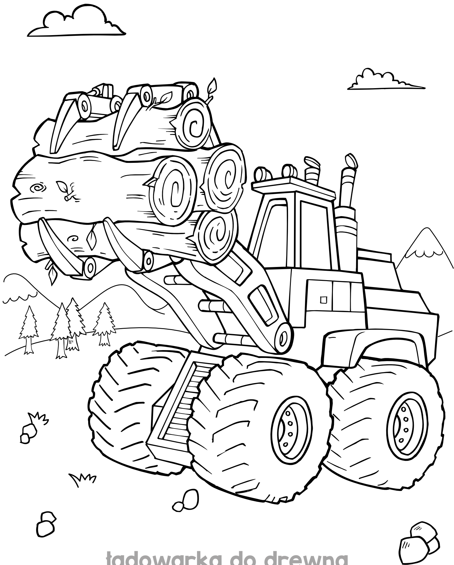
tadowarka do drewna